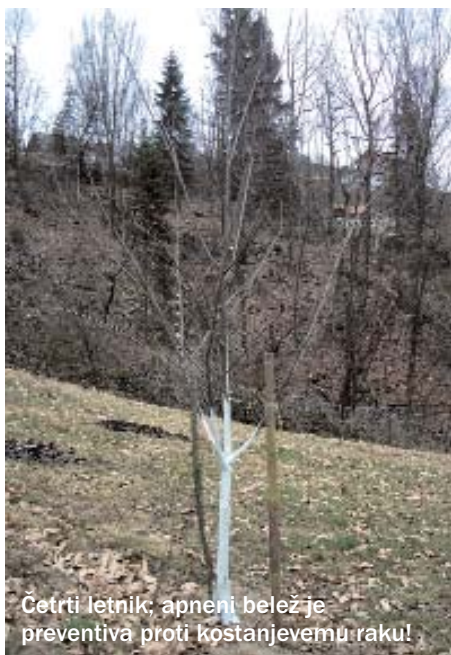
Četrty letnik; apneni beležje preventiva proti kostanjevemu raku!

barje zastremo s travo. Kasneje lahko mehansko obdelavo nadomesti herbicid: spomladi pripravek na osnovi glifosata, zgodaj jeseni na osnovi glufosinata. Mlada drevesa občasno pregledamo in če opazimo mehanske poškodbe, poškropimo z bakrenim pripravkom, da zaščitimo rane in preprečimo vdor glive kostanjevega raka. Enako ukrepamo po toči. Za gnojenje uporabimo hlevski gnoj. Z mineralnim dušikom začnemo dognojevati šele tretje leto po sajenju, da ne bi prizadeli mikorizne glive na koreninah. Nedopustno povišanja pH preprečimo z rabo fiziološko kislil gnojil, na primer amonsulfata. Dognojujemo v začetku aprila in sredi junija - pred brstenjem oz. pred cvetenjem. ■