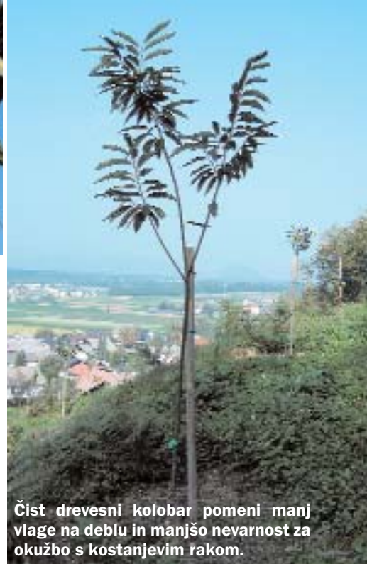
Čist drevesni kolobar pomeni manj vlage na deblu in manjšo nevarnost za okužbo s kostanjevim rakom.

gnojem. Če so tla revna z organsko snovjo, ga damo na dno sadilne jame, sicer pa samo pod zgornjo plast zemlje (skica).