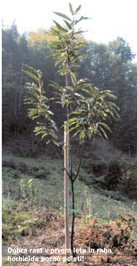
Dobra rast v prvem letu in raba herbicida pozno polet!

Sadimo jeseni. Če to ni mogoče, izkoristimo tisti zimski čas, ko zemlja ni zmrznjena. Sadilna jama naj bo velika vsaj 1 m in globoka 60 cm. Če imamo slabe izkušnje z voluharjem, tudi kostanj posadimo v zaščitno mrežo, čeprav se ga voluhar loti redkeje kot drugo sadno drevje. Če je le mogoče, korenine zasujemo s kostanjevo prstjo, nakopano v gozdu. Ta prst je bogata s humusom in naravno okužena s simbiotskimi glivami. Zaradi njih se poveča absorpcijska površina mladih korenin kostanja, izboljša se črpanje vode in hranil iz tal; avksini, ki jih producira gliva, pa pospešujejo nastanek novih korenin. Kostanj ob sajenju pognojimo tudi z uležanim hlevskim