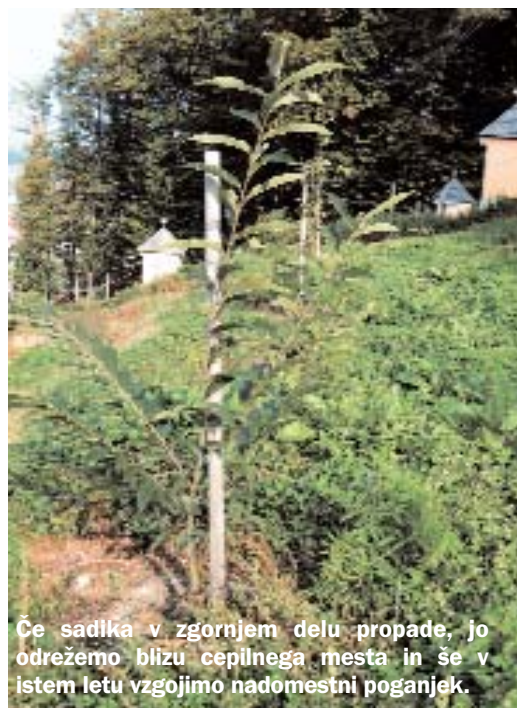
Če sadika v zgornjem delu propade, jo odrežemo blizu cepilnega mesta in še v istem letu vzgojimo nadomestni poganjek.

Med nujne ukrepe sodi vzdrževanje čiste površine okrog sadik. Prvo leto po sajenju kostanj dvakrat plitvo okopljemo in kolo-