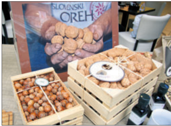
Pod blagovna znamka Slovenski oreh in Slovenski lešnik se tržijo kakovostni pridelki in izdelki.