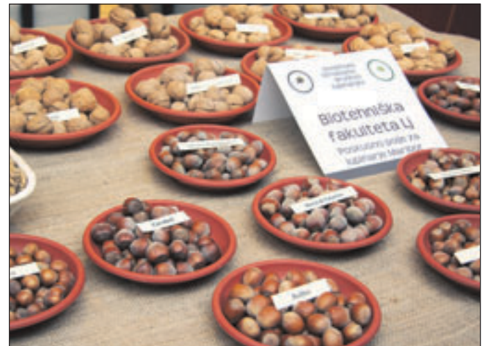
Biotehniška fakulteta ima dolgoletno tradicijo strokovnega dela z lupinastim sadjem.

Ob koncu je strokovnjak z mariborskega zavoda opozoril še na eno bolezen, ki je pri nas še nismo zaznali, v Italiji pa že, kar pomeni, da jo lahko v prihodnje pričakujemo tudi v Sloveniji. Imenujejo jo bolezen tisočerih rakov, gliva Geosmitha morbida pa je povezana z orehovim vejnim lubadarjem, ki jo prenaša. Bolezen je prišla v Evropo iz Severne Amerike, kje so jo opisali leta 2010. Prepoznavni znak te bolezni je nenadno močno sušenje oreha.