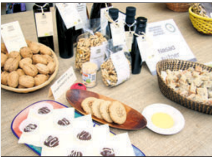
Obiskovalci celjskega trgovskega centra so poskušali dobrote članov društva.